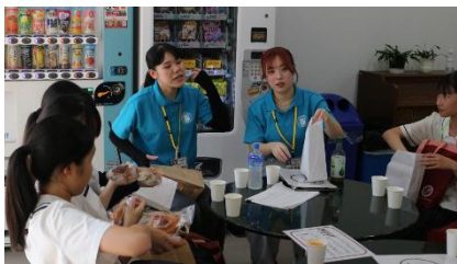
第2回 学生イベント 交流会

プログラム後半の個別相談会では、各学科、部・サークル活動、入試・学生生活などのブースも活気に満ちており、あっという間に終わりの時間となりました。