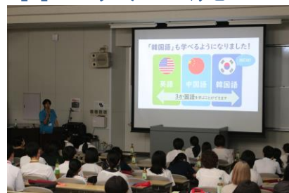
学生による学科紹介

今年も学生の生の姿を見てもらいたいということで、学生が企画したイベントを取り入れています。キッチンカー販売によるスイーツを食べながらの高校生と学生との交流会を開催し、大学生活やアルバイトなど、全体会では聞けなかった話で盛り上がっていました。