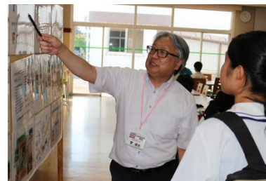
各学科の個別相談会

今後のオープンキャンパスは、9/14（土）に予定しています。ぜひ一度、鎮西学院大学を見て、雰囲気に触れてみてください。お待ちしております。